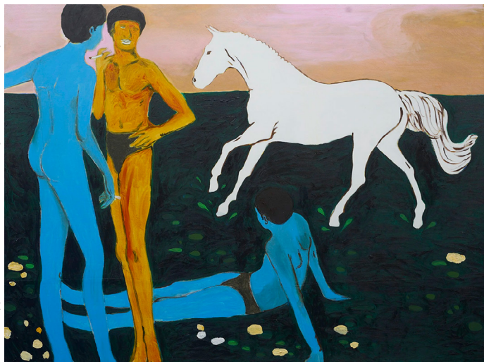
Gideon Appah, The Gathering , 2022, huile et acrylique sur toile, 183 x 224 cm © Gideon Appah.

Le peintre Gideon Appah (né en 1987 à Accra, Ghana), également diplômé de KNUST, puise dans les archives visuelles du Ghana – publicités et presse des années 1950 à 1980 – pour créer des compositions oniriques, peuplées de figures fictives ancrées dans une réalité historique. Rassemblant près d'une trentaine d'œuvres, dont une créée spécifiquement pour la Fondation Cartier, il s'agit de la première exposition de cette envergure du peintre en Europe.