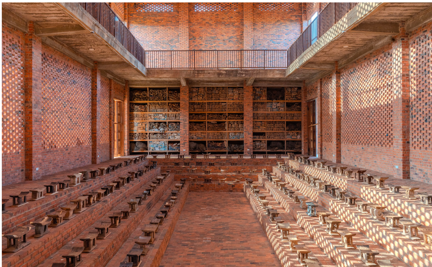
Ibrahim Mahama, Parliament of Ghosts , 2025, sièges aschantis en bois, Red Clay, Tamale. © Ibrahim Mahama.

Depuis sa création, la Fondation Cartier s'est affirmée comme un espace de dialogue, d'expérimentation et d'exploration artistique attentif aux lieux d'émergence de la création contemporaine et aux voix qui la traversent. Dès les années 1990, elle a joué un rôle pionnier dans la présentation d'artistes du continent africain, tels que Seydou Keïta, Bodys Isek Kingelez, Malick Sidibé, J. D. 'Okhai Ojeikere ou Chéri Samba. C'est dans cette continuité que s'inscrit Le Temps des récoltes , première exposition parisienne d'Ibrahim Mahama qui s'associe pour l'occasion à neuf artistes et collectifs.